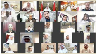
جانب من الاجتماع

المرحلة في أسرع وقت ممكن من خلال تكاتف جهود المجتمع أفراداً ومؤسسات. من جهته، أكد نائب رئيس الأمن العام حرص وزارة الداخلية لإحياء هذه المناسبة بشكل آمن وصحي للجميع خصوصاً في ظل الظروف الصحية الراهنة والأهمية الاستراتيجية المجتمعية في حفظ النظام العام وتنفيذ القانون، منوهاً إلى حرص مملكة البحرين على حرية ممارسة الشعائر الدينية المكفولة للجميع وفقاً للتقاليد المرغوبة في البلاد وفي إطار القانون. وأضاف أن تنظيم المناسبات الدينية، في بيئة آمنة وصحية يسهم في تعزيز الصورة الحضارية التي تتمتع بها مملكة البحرين، ودورها، أشارت الوكيل المساعد للرعاية الأولية بوزارة الصحة عضو الفريق الوطني للتصدي لفيروس كورونا إلى أن القطاع الصحي يراهن على وعي المجتمع، لاسيما القائمين على إحياء مناسبة عاشوراء، فيما أوضح ممثلو الفريق الطبي أن وقف التجمعات والتقييد بالضوابط الصحية والاحترازية له الأثر الكبير في تقليل الإصابات، أملياً تكاتف جهود الجميع لتجاوز هذه المرحلة بما يتعكس على صحة وسلامة الجميع.