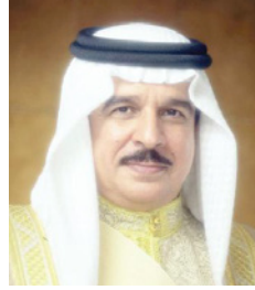
جلالة الملك المفدى

الخاصة بمحاربة التطرف ومكافحة الإرهاب وتمويله وغسل الأموال، والتنسيق مع الجهات المختصة في المملكة وأخذ آرائهم حول ذلك، وترفع اللجنة تقارير دورية بنتائج أعمالها إلى مجلس الوزراء، تتضمن الاقتراحات والتوصيات لاتخاذ ما يراه مناسباً في هذا الشأن. المادة الثالثة: تجتمع اللجنة بناءً على دعوة من رئيسها في المكان والزمان اللذين يحددهما، ويكون اجتماعها صحيحاً بحضور أغلبية الأعضاء على أن يكون من بينهم الرئيس. وتصدر اللجنة قراراتها وتوصياتها بأغلبية أصوات الأعضاء الحاضرين، وعند التساوي يرجح الجانب الذي منه الرئيس. المادة الرابعة: