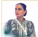
الشيخة مروة بنت عبدالرحمن

استضاف نادي روتاري سيف البحرين يوم الثلاثاء الماضي، وفي اللقاء الاعدادي عبر شاشة Zoom، رئيسة المؤسسة الخيرية لحماية الحيوان والبيئة الشيخة مروة بنت عبدالرحمن آل خليفة، التي تحدثت عن مستقبل مملكة البحرين في الاستدامة البيئية. حضر الاجتماع ضيوف النادي من البحرين والأردن ولبنان وكندا وغيرها من الزملاء الروتاريين والضيوف، إذ أشرت الشيخة مروة بنت عبدالرحمن الجميع بالمعلومات، إضافة إلى التحديات البيئية التي تؤثر مباشرة في مملكتنا خصوصاً ودول مجلس التعاون عمواً.