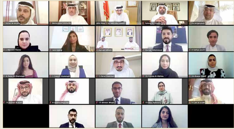
المنامة - بنا

♦ سمو ولي العهد: منتسبو برنامج الأول أدوا واجبهم الوطني على أكمل وجه