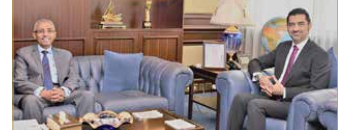
المنامة - هيئة الكهرباء والماء

استقبل وزير شؤون الكهرباء والماء والى المبارك بكميته سفير جمهورية مصر العربية ياسر شعبان والمعتد لدى مملكة البحرين. وفي بداية اللقاء، رحب الوزير بالسفير، مشيداً بما يربط البلدين الشقيقين من علاقات وطيدة متميزة بزهرتها التعاون المشترك في شتى المجالات التنموية. ونوقشت سبل تعزيز التعاون في مجالات تبادل الخبرات والتجارب ونقل المعرفة على عميد الكهرباء والماء، وبناء القدرات وتطوير التعاون بين مملكة البحرين وجمهورية مصر العربية الشقيقة في هذا المجال. وتم أثناء اللقاء، مناقشة أهم المشاريع التي تقوم بها هيئة الكهرباء والماء، بما يتماشى مع رؤية المملكة الاقتصادية واستراتيجيتها الوطنية 2030، وبما يحقق متطلبات النمو العمراني والسكاني. من جانبه، أعرب السفير المصري عن شكره وتقديره للوزير المبارك على الاستقبال، وأكد استعداد بلاده دائماً لتعزيز التعاون الثنائي.