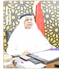
رئيس الأوقاف الجعفرية

المرحلة في أسرع وقت ممكن من خلال تكاتف جهود المجتمع أفراداً ومؤسسات. من جهته، أكد نائب رئيس الأمن العام حرص وزارة الداخلية لإحياء هذه المناسبة بشكل آمن وصحي للجميع خصوصاً في ظل الظروف الصحية الراهنة والأهمية الاستراتيجية المجتمعية في حفظ النظام العام وتنفيذ القانون، منوهاً إلى حرص مملكة البحرين على حرية ممارسة الشعائر الدينية المكفولة للجميع وفقاً للتقاليد المرغوبة في البلاد وفي إطار القانون. وأضاف أن تنظيم المناسبات الدينية، في بيئة آمنة وصحية يسهم في تعزيز الصورة الحضارية التي تتمتع بها مملكة البحرين، ودورها، أشارت الوكيل المساعد للرعاية الأولية بوزارة الصحة عضو الفريق الوطني للتصدي لفيروس كورونا إلى أن القطاع الصحي يراهن على وعي المجتمع، لاسيما القائمين على إحياء مناسبة عاشوراء، فيما أوضح ممثلو الفريق الطبي أن وقف التجمعات والتقييد بالضوابط الصحية والاحترازية له الأثر الكبير في تقليل الإصابات، أملياً تكاتف جهود الجميع لتجاوز هذه المرحلة بما يتعكس على صحة وسلامة الجميع.