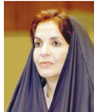
قريبة عاهل البلاد المفدى

هناك صاحبة السمو الملكي الأميرة سبيكة بنت إبراهيم آل خليفة قريبة عاهل البلاد المفدى رئيسة المجلس الأعلى للمرأة، المهندسة مريم أحمد جمعان عضو المجلس الأعلى للمرأة بمناسبة صدور المرسوم الملكي لسمرة لحضرة صاحب الجلالة الملك حمد بن عيسى آل خليفة عاهل البلاد المفدى بتعيينها رئيساً لمجلس إدارة هيئة تنظيم الاتصالات. وأكدت صاحبة السمو الملكي أن هذا التكليف السامي يأتي في إطار ما تشهده المرأة البحرينية من دعم وتشجيع يتسق